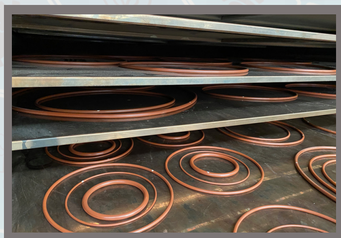
2 - Ampla estufa para disposição das peças evitando deformidades.