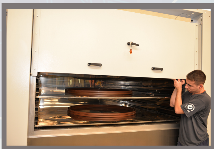
1 - Estufa de ar circulante 1.800 X 1.800mm