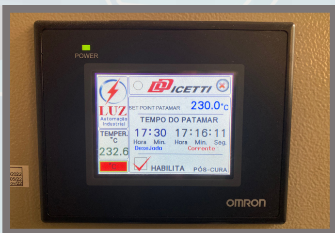
3 - Controle de processo via CLP